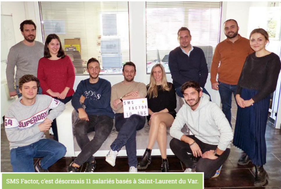
SMS Factor, c'est désormais 11 salariés basés à Saint-Laurent du Var.